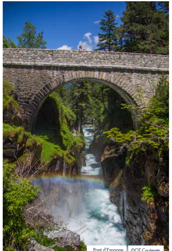
Pont d'Espagne