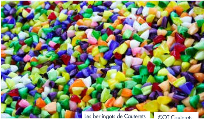
Les berlingots de Cauterets