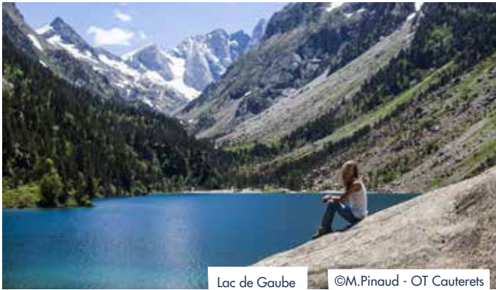
Lac de Gaube