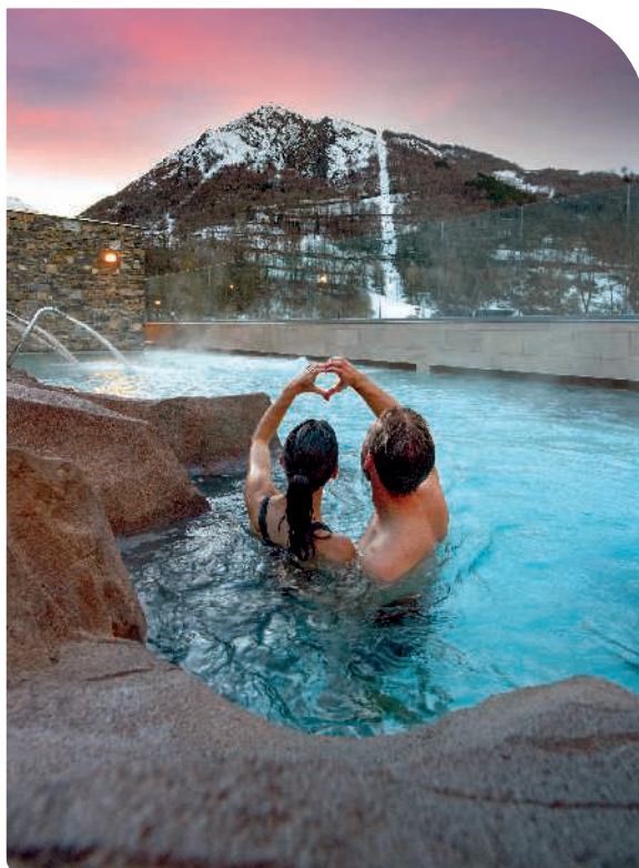
Après le ski, les centres thermo-ludiques soignent les muscles endoloris avec pour décor les hauts sommets des Pyrénées, par exemple le centre Sensoria Rio.

A u XIX e siècle, passé Lourdes, les voyageurs filaient au cœur des Hautes-Pyrénées pour rejoindre les stations thermales de Cauterets, Luz-Saint-Sauveur ou Bagnères-de-Bigorre. De l'impératrice Eugénie à Victor Hugo, les visiteurs étaient prestigieux. Aujourd'hui encore, on vient de loin pour profiter des bienfaits de leurs eaux sulfureuses. Mais entre-temps, les sommets se sont couverts de pistes, permettant à la région de combiner les joies de la glisse et la détente dans des installations qui, au-delà des équipements pour curistes, accueillent désormais de voluptueux centres de balnéo. Ils font du massif pyrénéen une destination dans l'air du temps, aux vallées préservées et aux stations à taille humaine. L'ouverture d'un téléphérique filant jusqu'au sommet du pic de Lumière en 1957 a fait basculer le village de Saint-Lary-Soulan dans une autre dimension. Les 100 km de pistes (dont