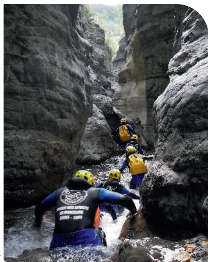
A Saint-Lary-Soulan , combi, gants et lycra sont de rigueur pour expérimenter le canyoning en hiver.

Alterner le mordant de la neige fraîche et la douce chaleur des bassins d'eaux thermales : les stations pyrénéennes répondent à des vacanciers esthètes pour qui le ski rime avec tradition, entre bien-être et art de vivre.