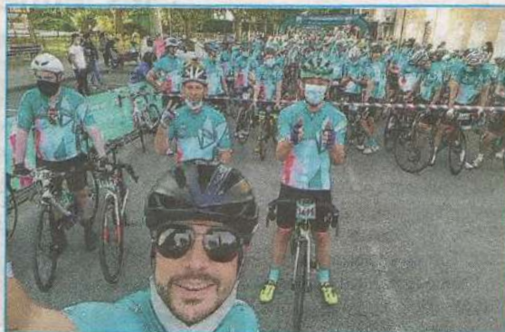
Au départ de la course.

cérébrale découverte en 2011. Pour rendre hommage à Tatiana, l'organisation lui a permis avec son groupe de cyclistes-grimpeurs d'ouvrir la course regroupant pour cette année 3 000 participants.