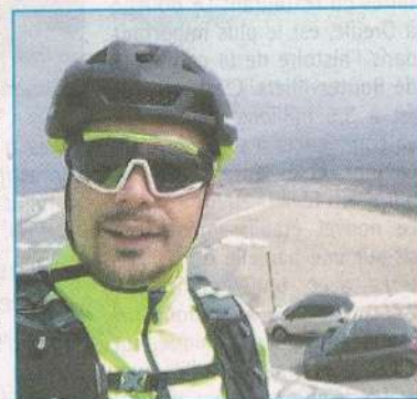
En avril 2019, il a gravi le Mont Ventoux, comme en juin 2018.

• Pour le suivre : sur sa page Facebook "VTT&Gravel Handisport"