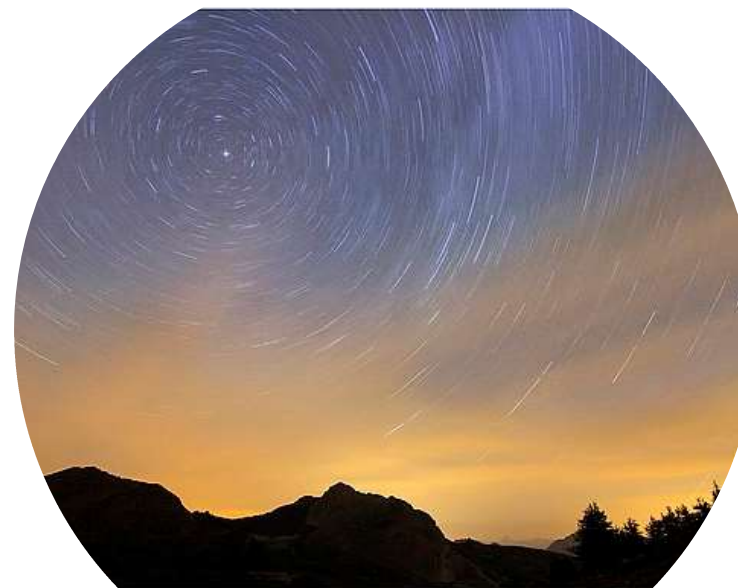
Laurent Rouschmeyer © 2015