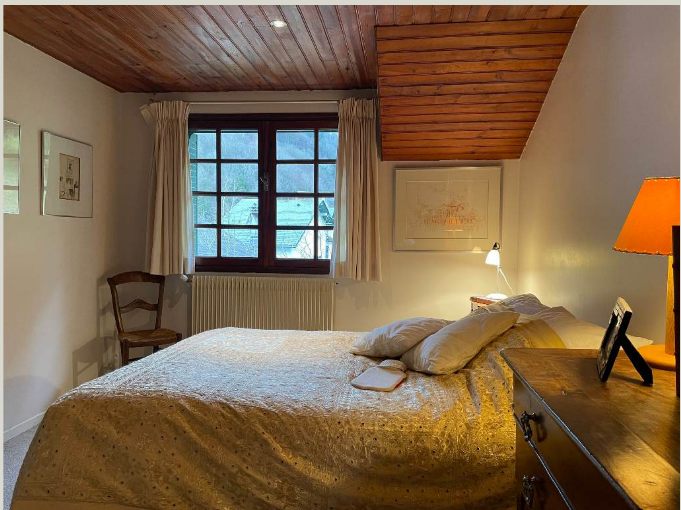
Chambre Double 3 (1er)