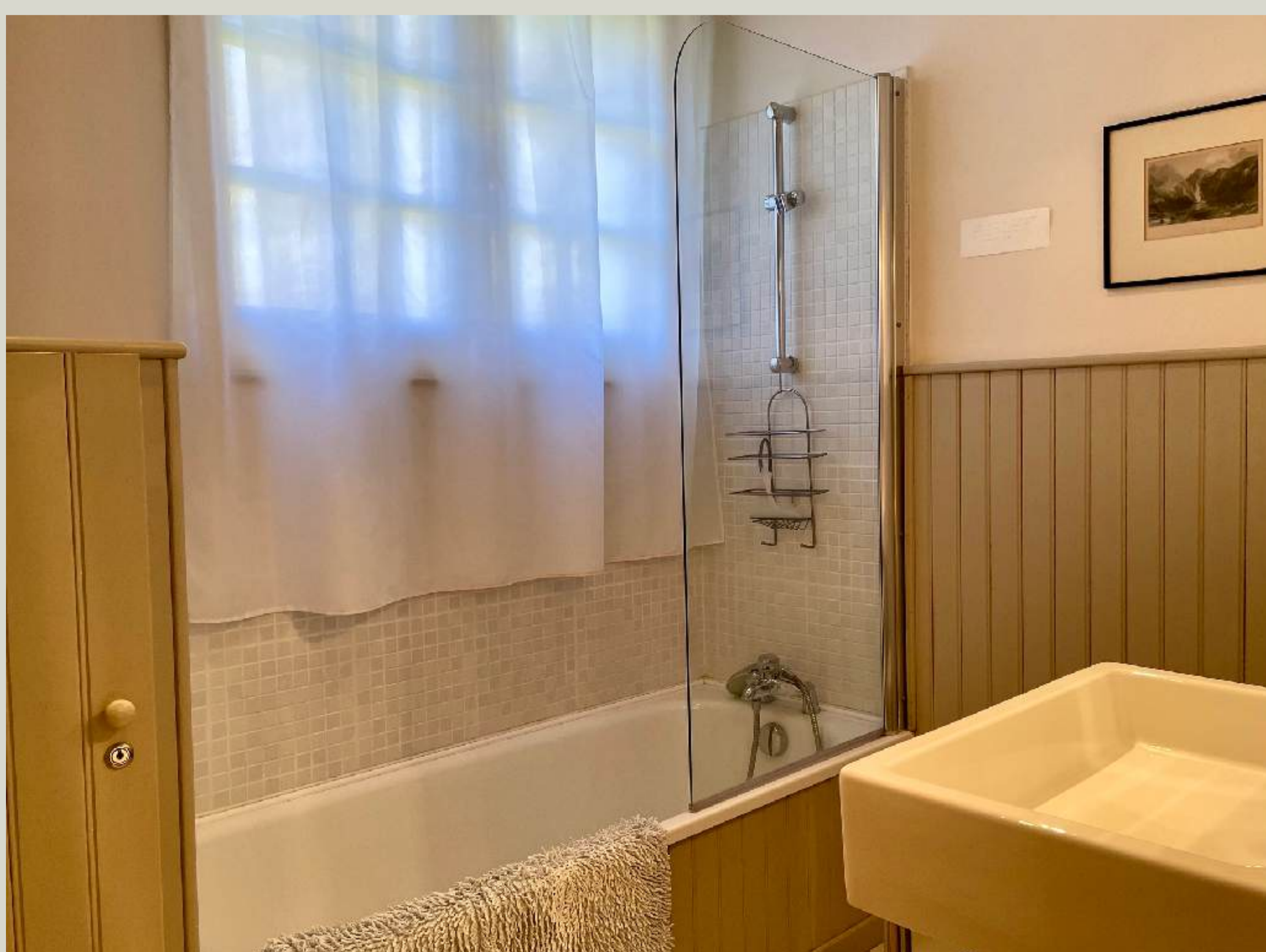
Salle de bain 1 (RDC)