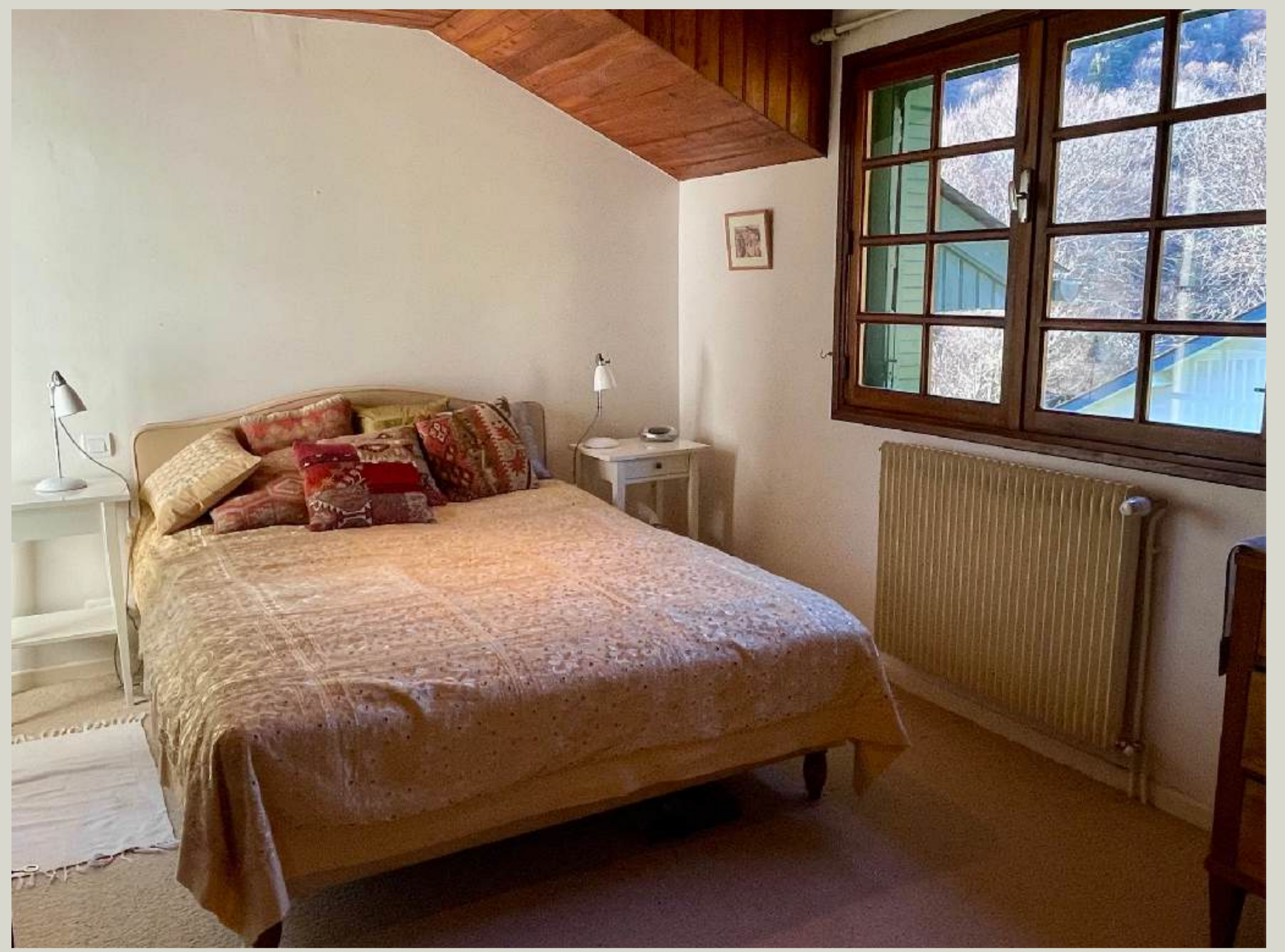
Chambre Double 2 (1er)