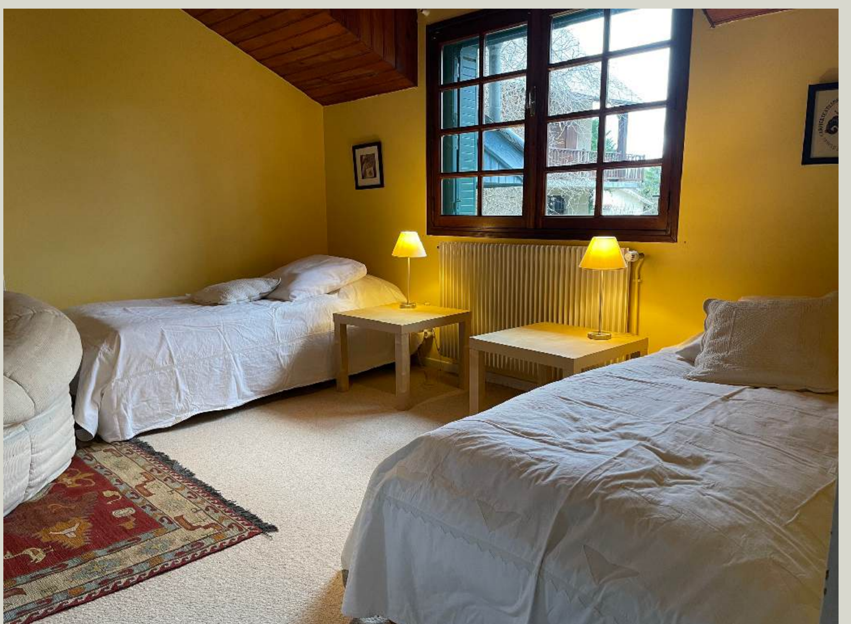
Chambre Jumeaux (1er)