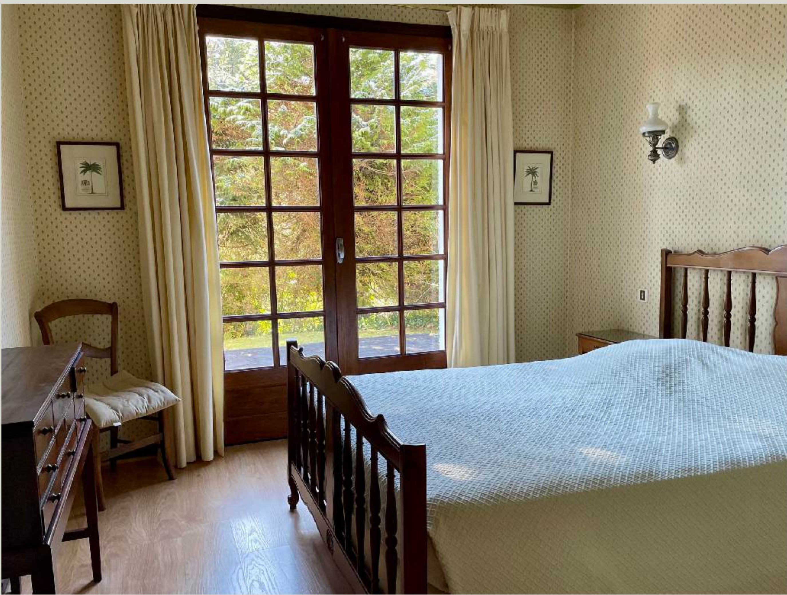
Chambre Double 1 (RDC)