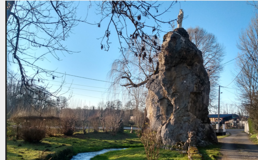
Rocher d'Anères (CCNB)