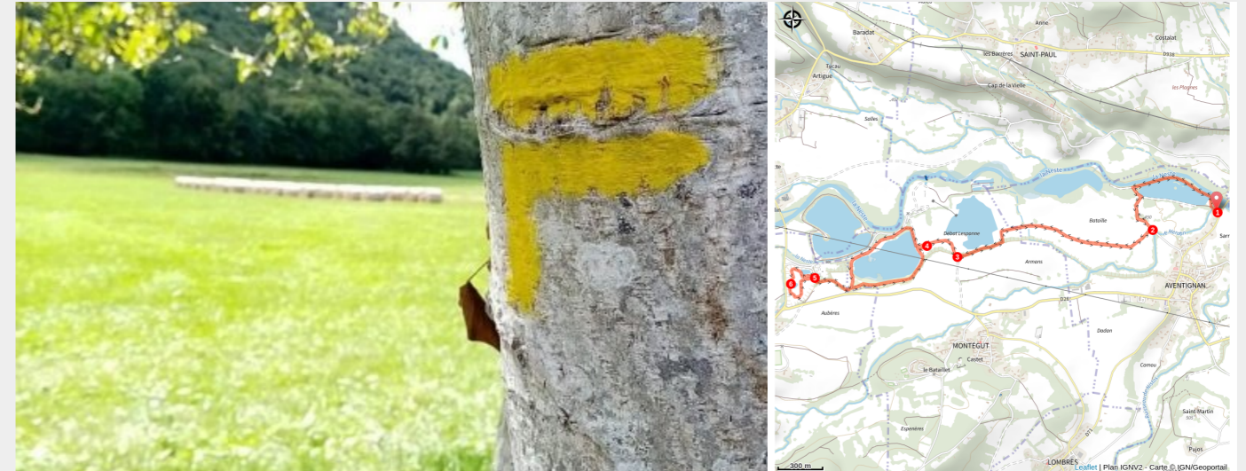
sur les chemins pyrénéens - Aventignan [65] (CCNB)