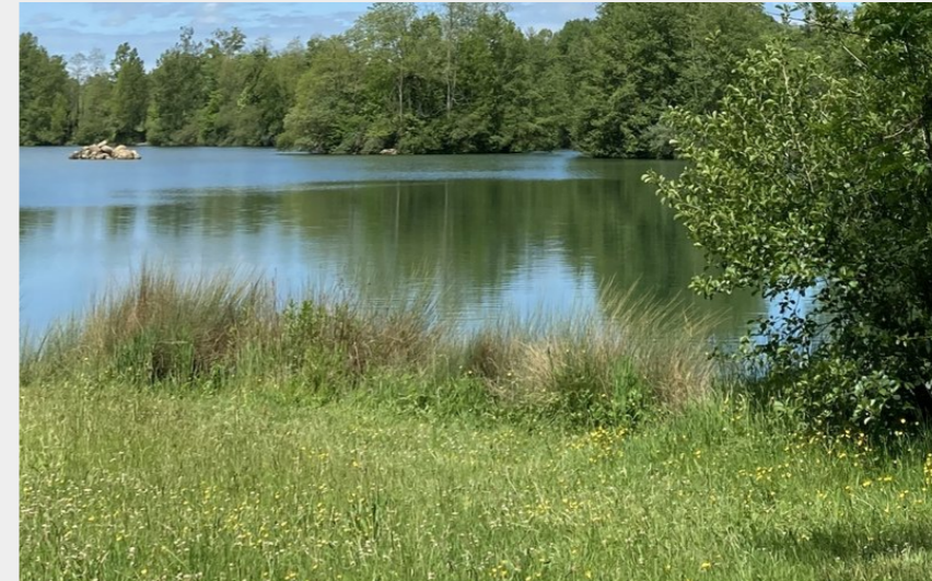
lac le Hourquet Aventignan [65] (CCNB)