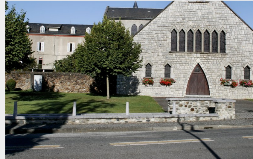
Eglise de Cantaous (CCNB)