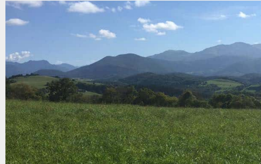
Paysage de Créchets (CCNB)