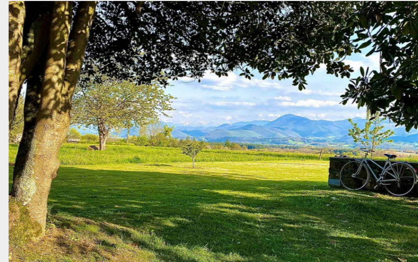
Paysage depuis Cantaous (CCNB)