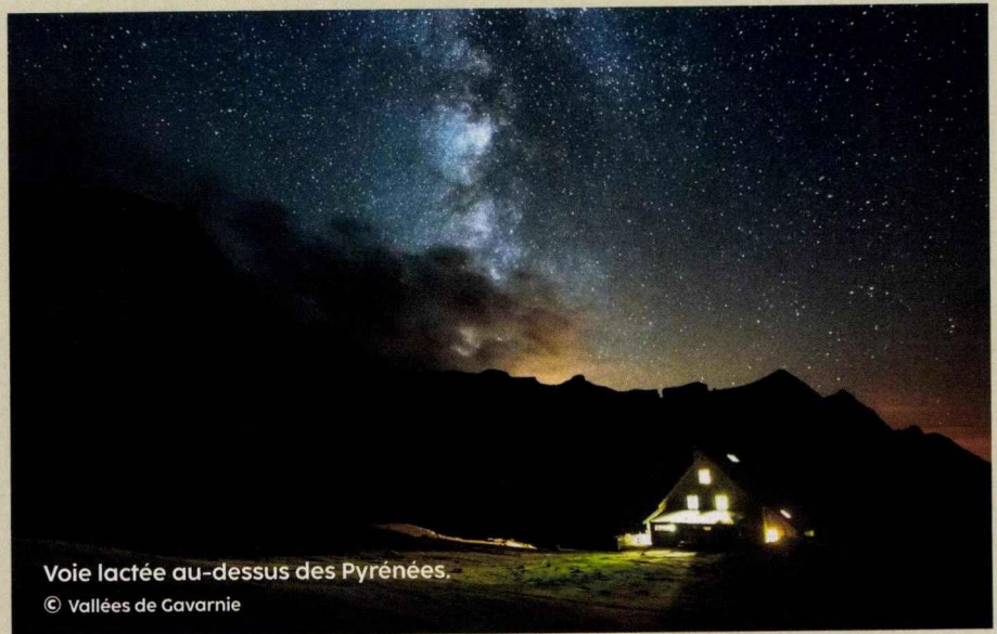
Voie lactée au-dessus des Pyrénées.