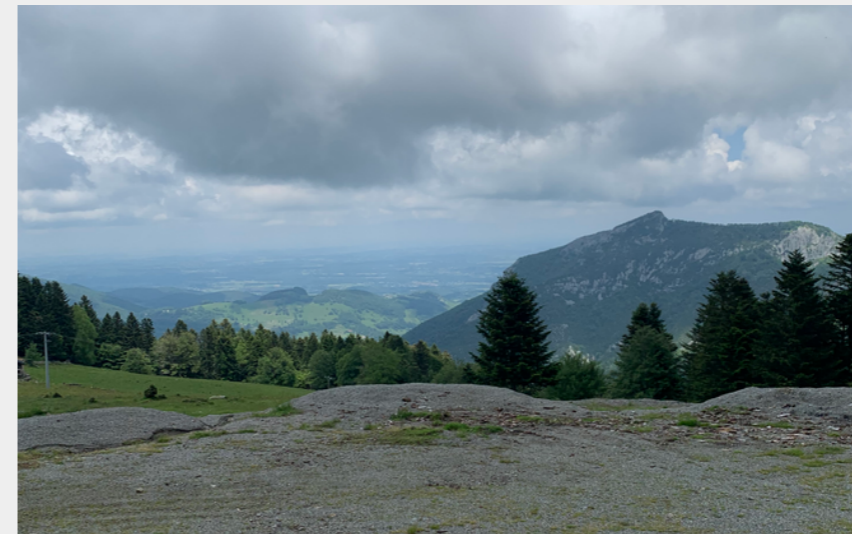
Point de vue Cap Nestès (CCNB)