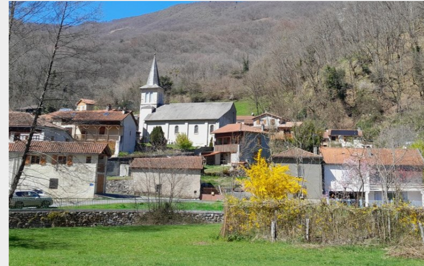
Village de ferrère (CCNB)