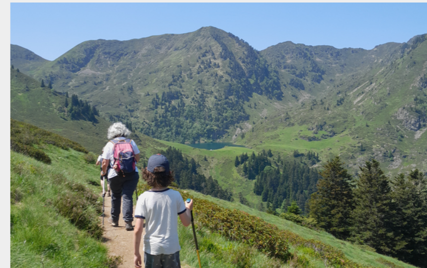
Lac de Bordères (CCNB)