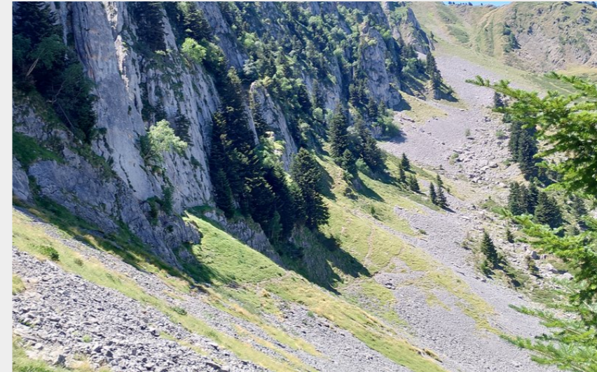
Vue sur la montagne d'Areng (CCNB)