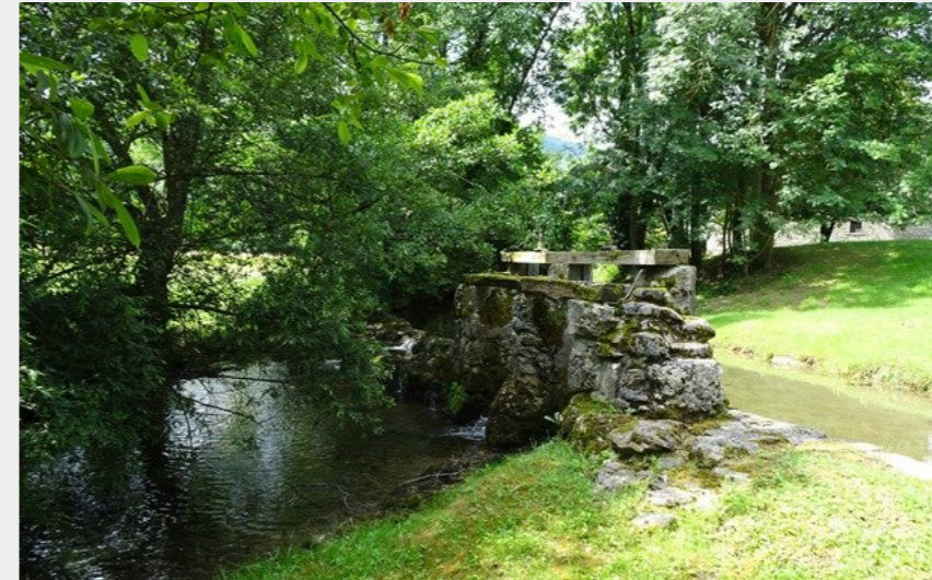
Bois de Laubagne (CCNB)