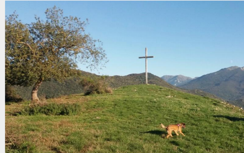
Croix du Mail de Maubourg (CCNB)