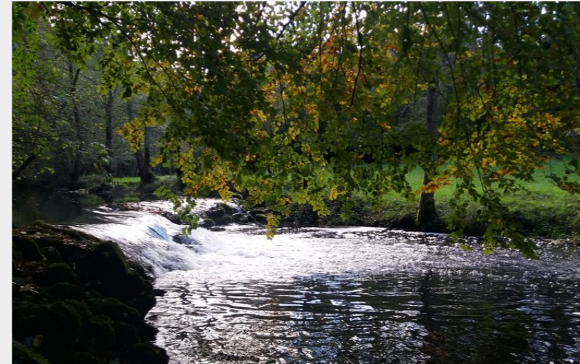
Ruisseau de Nistos (CCNB)