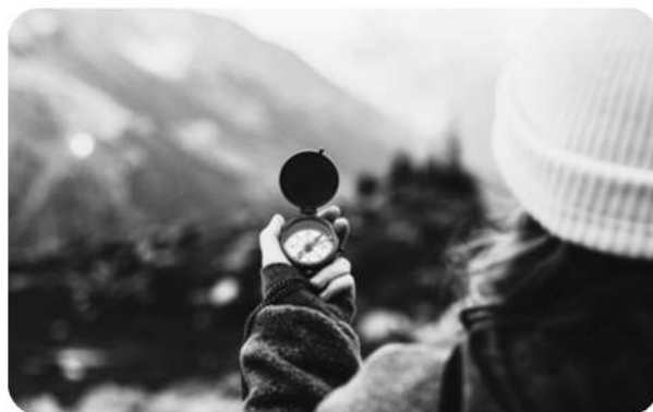
Illustration des "pionniers associatifs"

L'ensemble de ces acteurs contribue ainsi à installer durablement l'éducation à l'environnement comme un champ d'action légitime, avant même l'apparition de la notion de développement durable dans les politiques publiques des années 1980-1990.