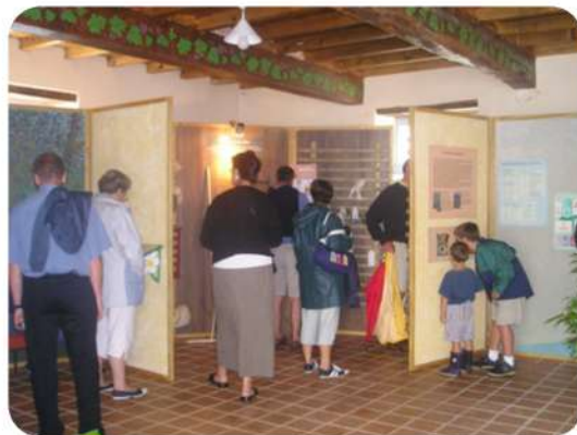
Exposition "Secrets de plantes" (2004)

Cette période consacre ainsi le CPIE comme expert de proximité, capable de lier enjeux environnementaux, développement local et participation citoyenne.