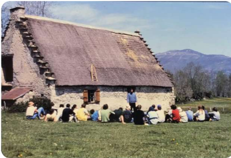
Animation sur la Montagne et le Pastoralisme (1983)

Dans les Hautes-Pyrénées, le réseau associatif se renforce : des structures comme la Fédération des Œuvres Laïques (FOL 65) organisent des classes vertes, tandis que des associations naturalistes locales lancent les premiers inventaires participatifs de flore de vallée ou des campagnes sur la qualité des torrents pyrénéens. C'est aussi la période où se dessine la future dynamique des CPIE, avec des groupes de terrain qui expérimentent des sentiers d'interprétation, des animations en centres de vacances et des programmes éducatifs annuels en lien avec les écoles rurales. Ensemble, ces initiatives posent les bases d'une EEDD structurée et durable dans le territoire. C'est d'ailleurs à ce moment-là, en 1984, que l'Union régionale des CPIE de Midi-Pyrénées est créée.