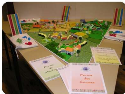
Outil pédagogique sur les plantes messicoles

Cette période est aussi celle de la modernisation des supports, avec le remplacement du lecteur de diapositives par un vidéoprojecteur, illustrant la volonté du CPIE d'adapter ses méthodes aux évolutions technologiques et pédagogiques.