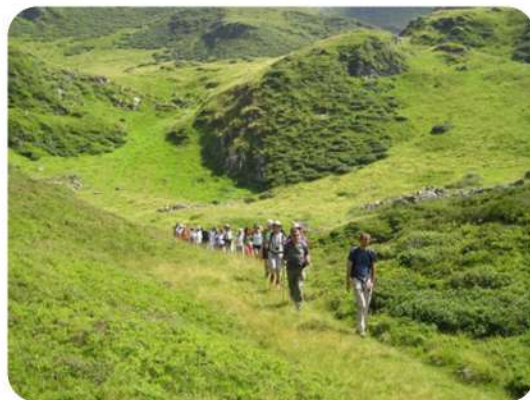
Sortie nature grand public (2010)