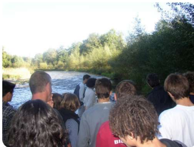
Formation pour les BTS GPN de Mirande (2001)

Enfin, le CPIE obtient en 1999 une convention structurante avec le Conseil Général des Hautes-Pyrénées et l'ADEME pour réaliser des actions de sensibilisation pour les scolaires autour de la question du tri et du compost dans le cadre du Plan Départemental d'Élimination des Déchets Ménagers et Assimilés (PDEDMA), anticipant l'organisation future du SYMAT (syndicat mixte de collecte des déchets sur une partie du territoire des Hautes-Pyrénées)..