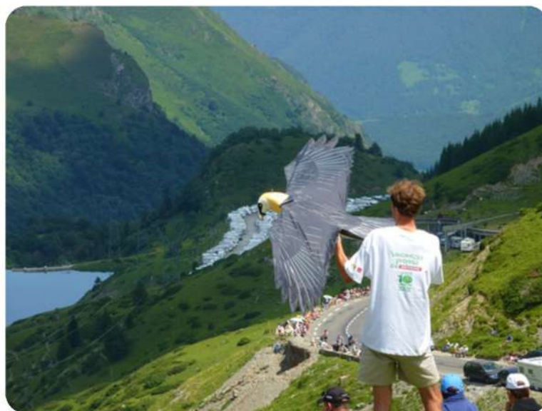
Sensibilisation lors du Tour de France (La Mongie) en 2010