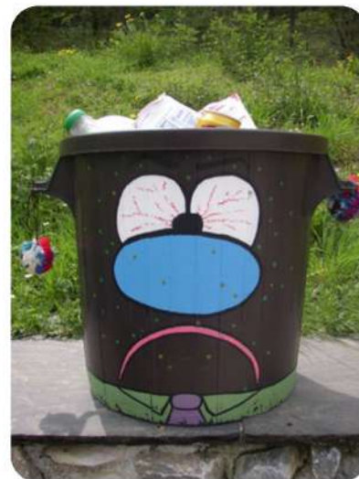
"Mimi cracra", outil de sensibilisation aux déchets

Parallèlement, en partenariat avec l'ARPE, l'équipe intervient sur des événements de grande ampleur, comme le Tour de France, pour sensibiliser le public et les organisateurs aux enjeux de gestion des déchets, montrant ainsi sa capacité à conjuguer éducation, innovation et mobilisation citoyenne.