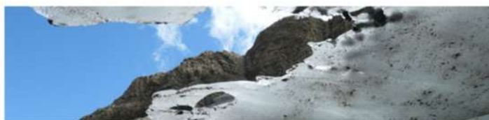
Glacier du Vignemale, 2022

Enfin, la loi Climat et Résilience (2021) représente une étape importante : elle encourage notamment les collectivités à intégrer les enjeux environnementaux dans leurs plans éducatifs territoriaux, tout en reconnaissant le rôle central des acteurs de l'EEDD dans la transition écologique.