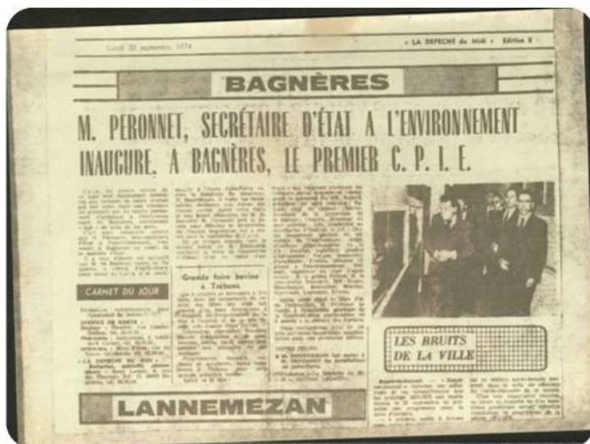
Article La Dépêche du 30/09/1974