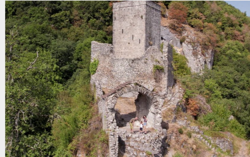
Chateau de Bramevaque (CETIR-Simon DASQUE-CCNB)