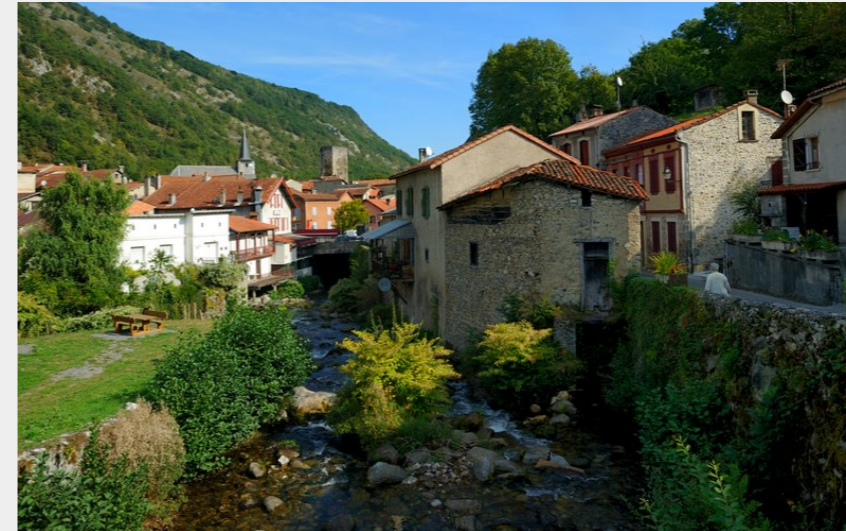
Convergence des deux Ourses à Mauléon-Barousse (Jean Noël HERRANZ)