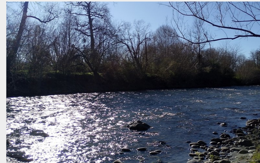
Bord de Neste (CCNB)