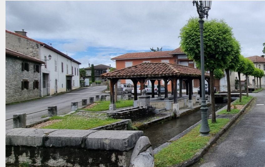
Place de St-Paul à Mazères-de-Neste (CCNB)