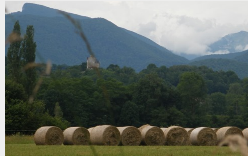
Chateau de Montégut au loin (CCNB)