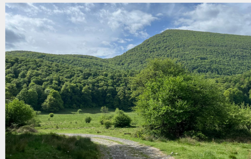
Paysage de Bayelle de Gazave (CCNB)