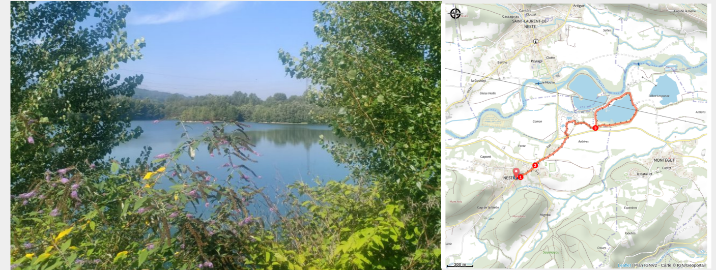
Lac des Ocybelles à Saint-Laurent-de-Neste (CCNB)

Découvrez le site des Ôcybelles où la baignade est possible en juillet et août dans la piscine naturelle. Profitez également toute l'année du parcours sportif autour du lac et d'un espace jeux pour les plus petits.