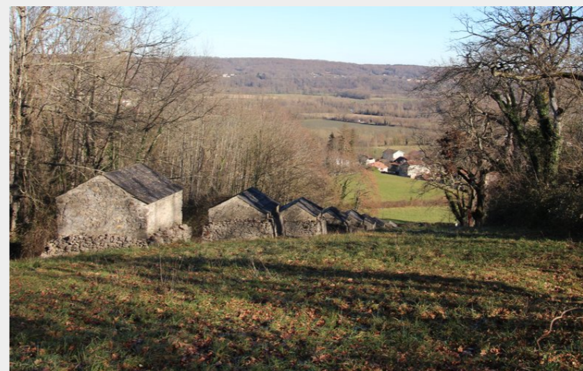
Vue depuis le Mont Arès (CCNB)