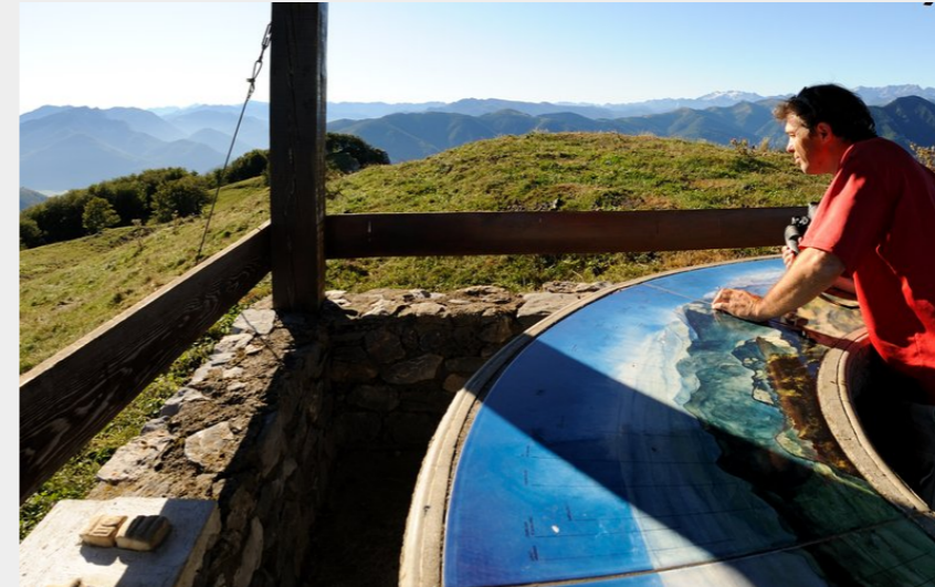
Table d'orientation - Pic du Tourroc (CCNB)