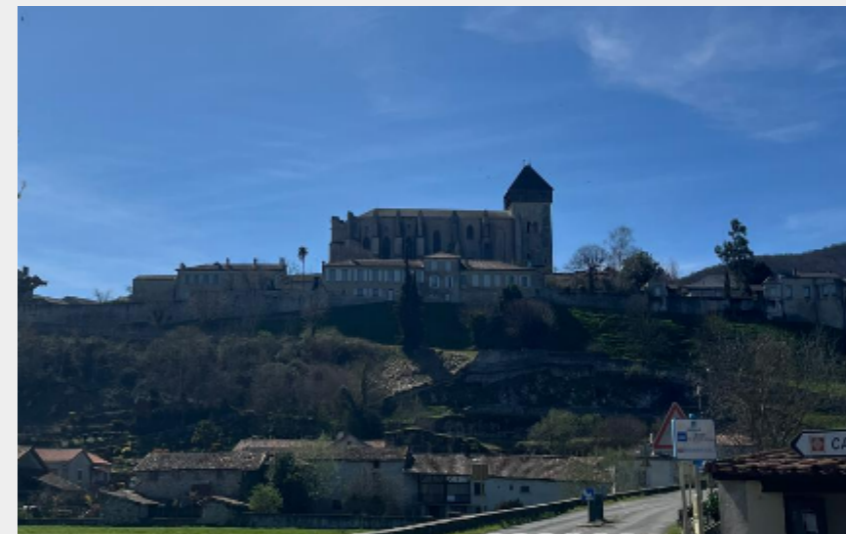
Cathédrale de Saint-Bertrand-de-Comminges