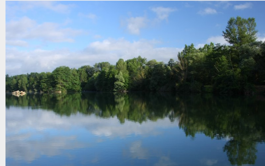
Lac d'Aventignan (CCNB)