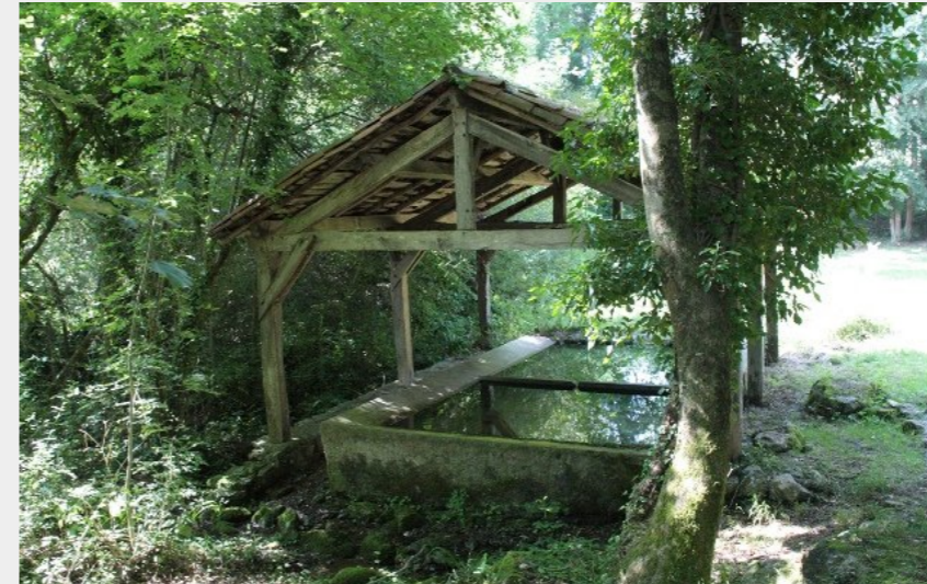
Lavoir de Tibiran-Jaunac (CCNB)