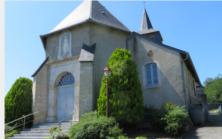
Eglise de Tuzaguet (CCNB)