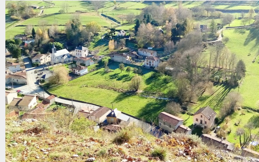
Village de Cazarilh (CCNB)