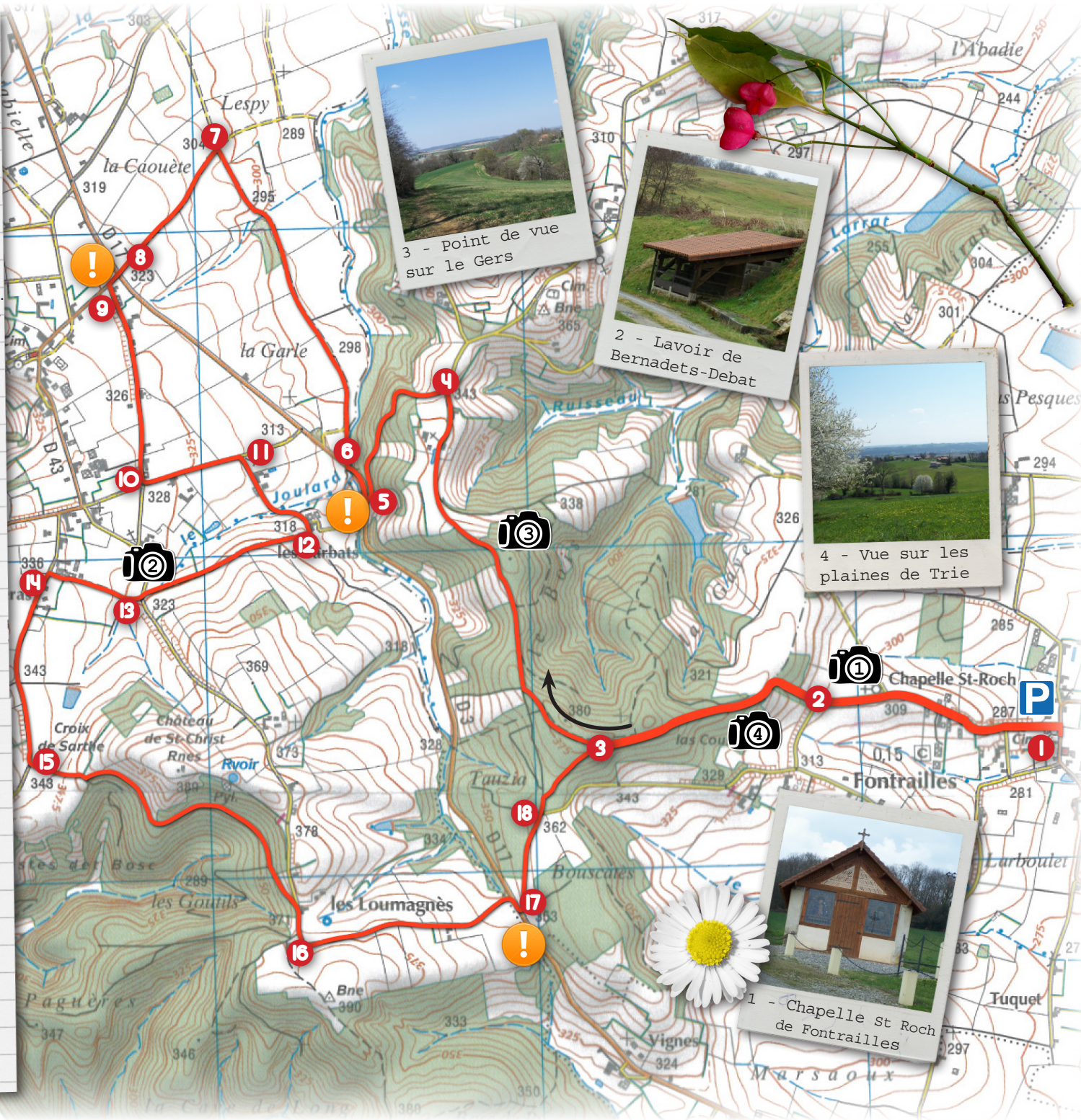
3 - Point de vue sur le Gers